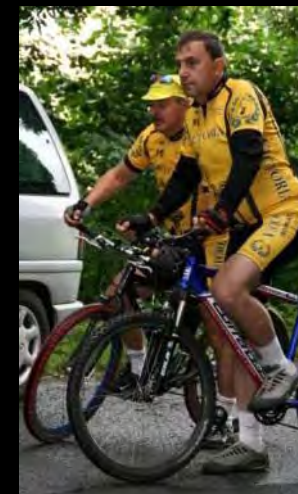
C C Victoria Głuchołazy' cyclists