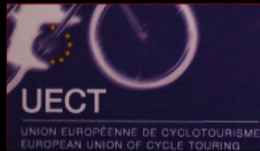
Union Européenne de Cyclotourisme