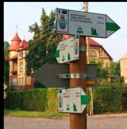
Prudnik, ul. Dąbrowskiego