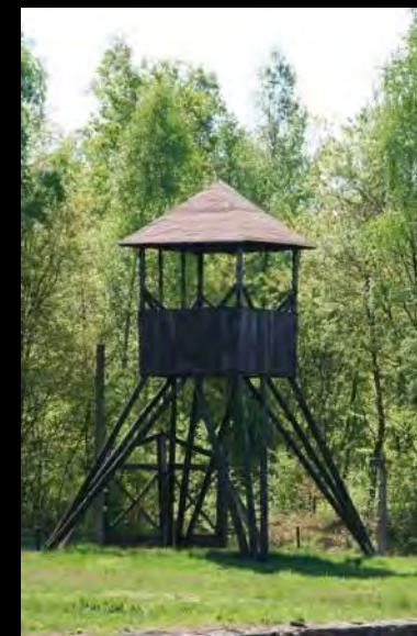
Zrekonstruowana wieżyczka strażnicza obozu jeńców wojennych Lamsdorf