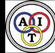
Alliance Internationale de Tourisme