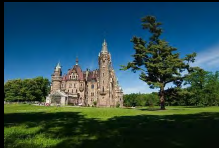
Zamek Thiele-Winckelów w Mosznej