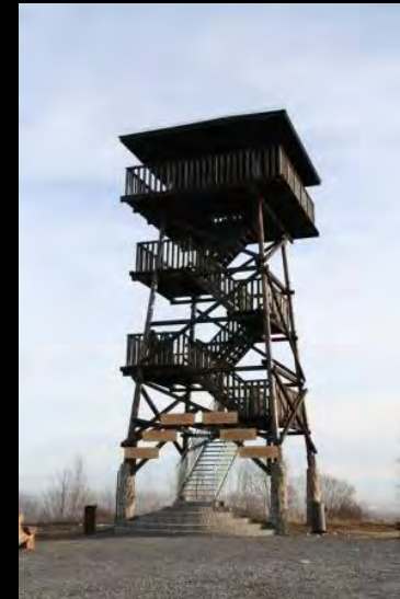
wieża widokowa na Koziej Górze