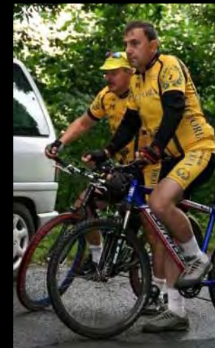
C C Victoria Głuchołazy' cyclists