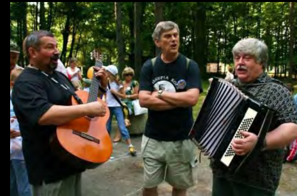
Rozśpiewane trio z prudnickiego PTTK