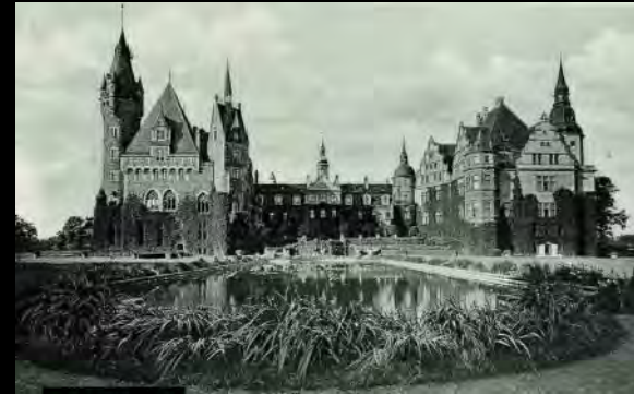
Zamek Thiele-Wincklerów w Mosznej