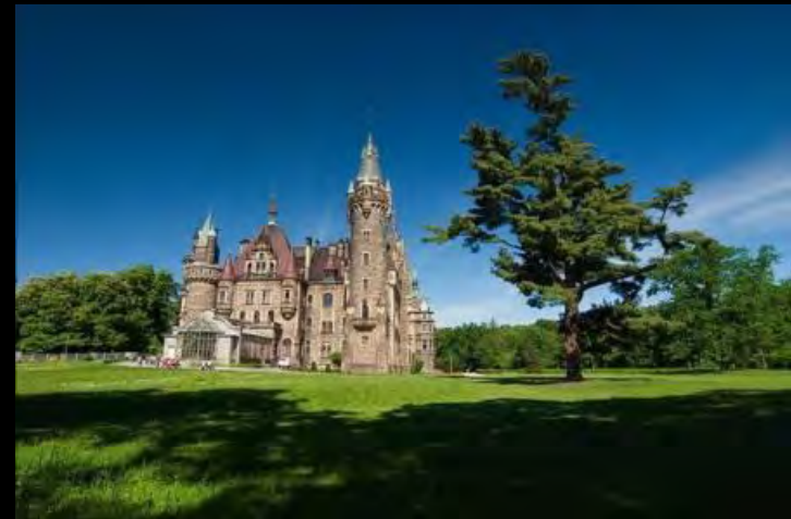
Zamek Thiele-Winckelów w Mosznej