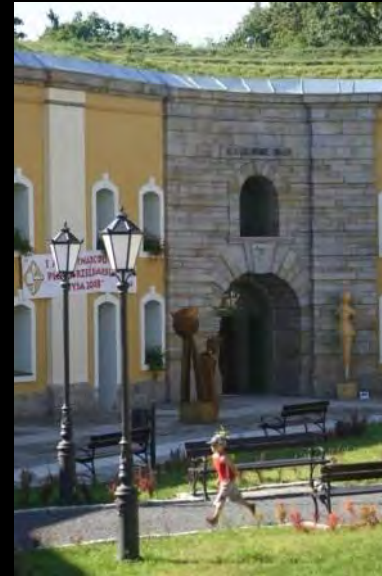
Fort św. Jadwigi w Nysie