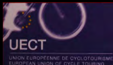
Union Européenne de Cyclotourisme