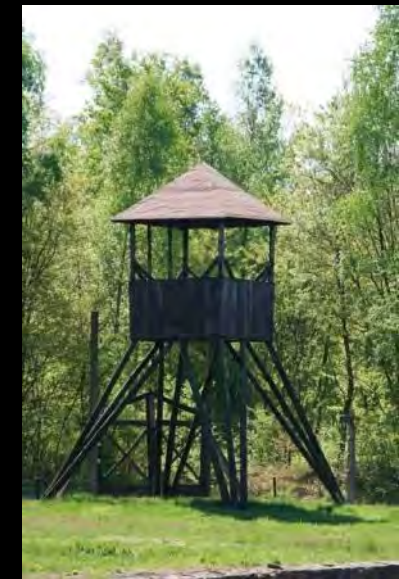
Zrekonstruowana wieżyczka strażnicza obozu jeńców wojennych Lamsdorf