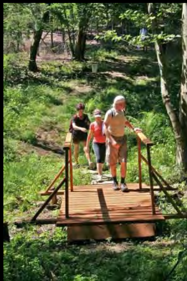
Mostek Andrzeja w Lesie Prudnickim