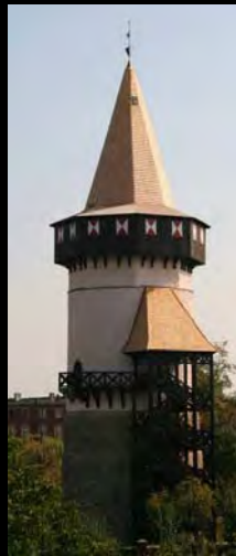
Voor (2008) ... Na (2009) Woka toren in Prudnik