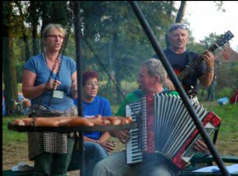
Evento cicloturístico Pttk na Zary 2009