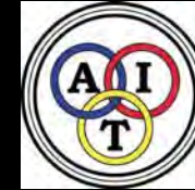
Alliance Internationale de Tourisme