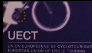
Union Européenne de Cyclotourisme