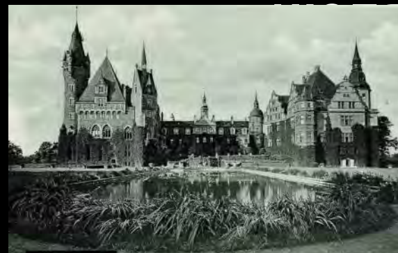
Zamek Thiele-Wincklerów w Mosznej