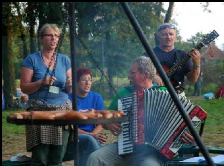
Cycletourist Pttk event at Zary 2009