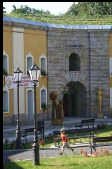
Форт св. Ядвиги (Ниса)