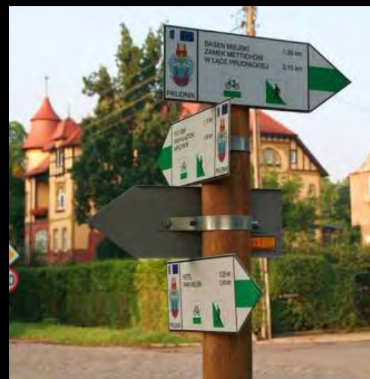
Прудник, ул. Домбровского