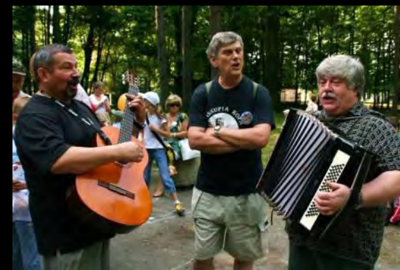
Трио прудницконо РТТК в полном действии