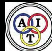
Alliance Internationale de Tourisme