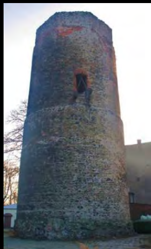
Прудник: Башня Вока