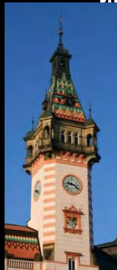
City Hall in Krnov (Rep. Czeska)