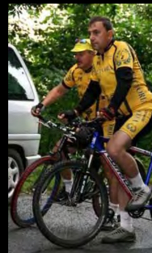
С С Victoria Głuchołazy' Слалом