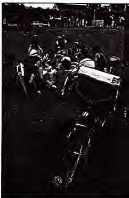
Arrêt repos sur le gazon anglais.

Après une bonne nuit de sommeil et un copieux petit-déjeuner, les jeunes randonneurs enfourchent en pleine forme leur bicyclette dans un but bien précis : le bord de mer et, en l'occurrence, la