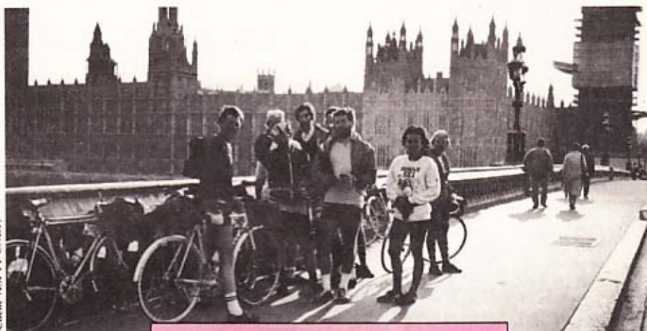
Le trait d'union Paris-Londres vient d'être tiré par les cyclorandonneurs de l'ASPTT-CNET. Ils posent sur Westminster Bridge sur arriére de Parlement.

Découvrir l'Europe à vélo : c'est ce que propose la section cyclotourisme de l'ASPTT-CNET avec ses « Traits d'union européens », qui concilient sport et tourisme.