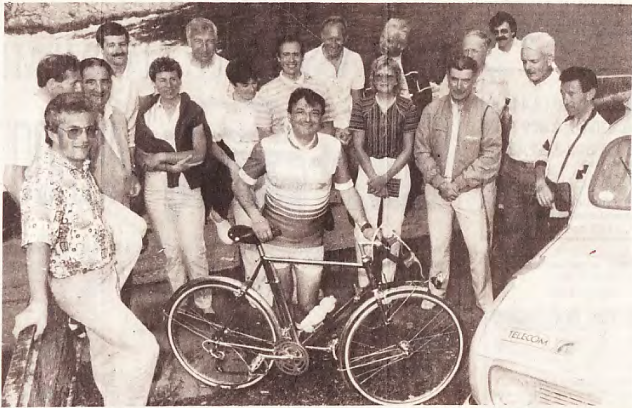
L'escale nayaise a été fort appréciée par les randonneurs PTT accueillis par leurs collègues béarnais